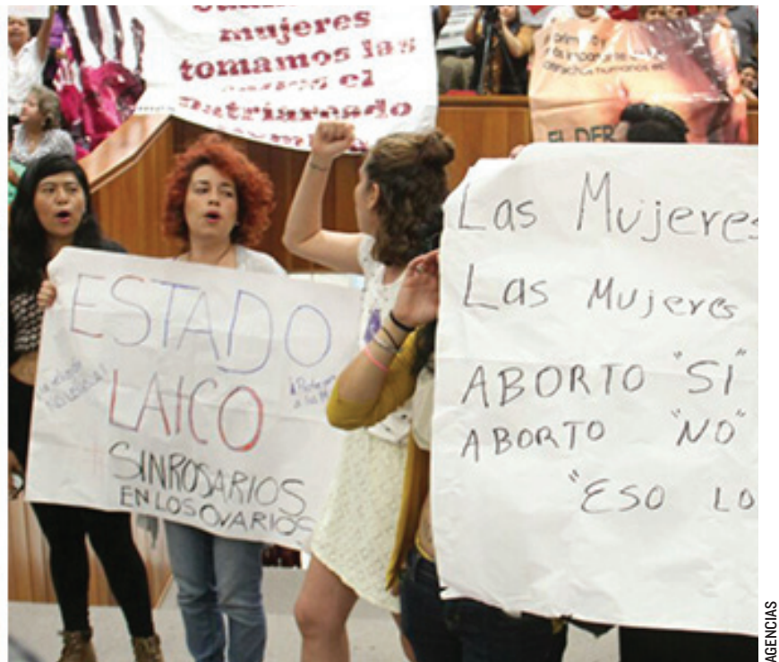
LA GUERRA VERBAL Y DE PANCARTAS entre defensores de la reforma y colectivos feministas contrarios a ella, provocó que por momentos se interrumpiera la sesión legislativa.