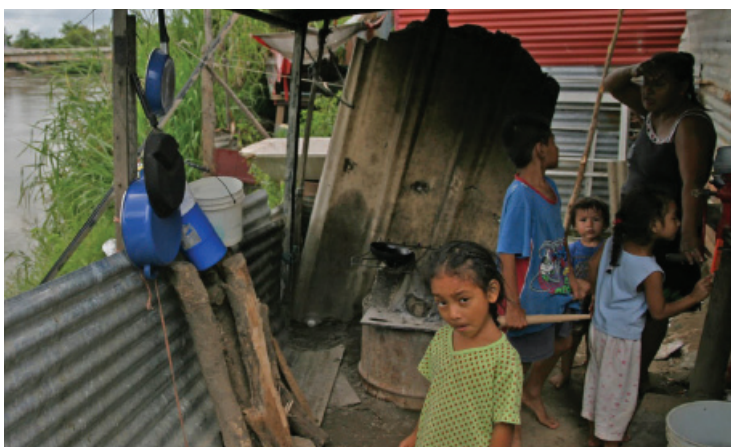
PARA NOVIEMBRE se tendrían nuevos resultados de la evaluación del Coneval que iniciará el 15 de agosto.